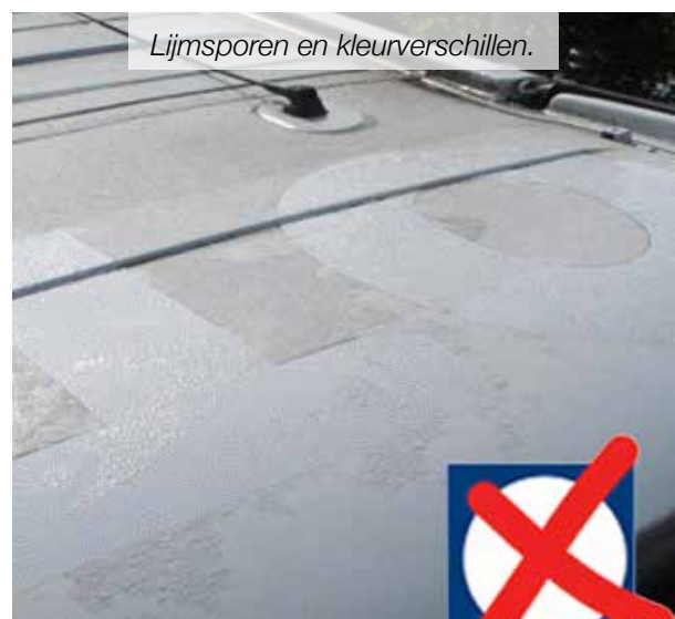
Lijmsporen en kleurverschillen.